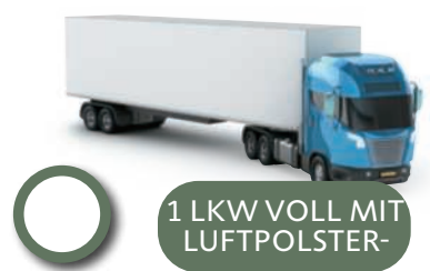
1 LKW VOLL MIT LUFTPOLSTER-