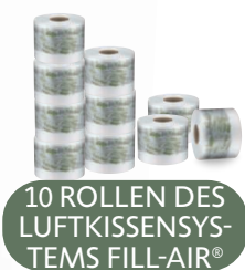
10 ROLLEN DES LUFTKISSENSYSTEMS FILL-AIR®

Die Rollen benötigen nur 1% des Platzbedarfs aufgeblasener Luftkissen.