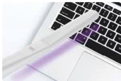
UTILIZZO SU TUTTE LE SUPERFICI