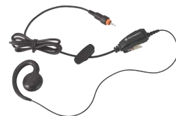
Auricular con botón de pulsar para hablar (PTT) integrado

Este diseño revolucionario de líneas perfectas ofrece una carga rápida para su CLP de Motorola. Un cargador de unidades múltiples le permite cargar cómodamente hasta seis CLP de Motorola al mismo tiempo. El cargador está diseñado con un bolsillo trasero para guardar su auricular mientras se carga la unidad, y se puede montar sobre la pared si no hay mucho espacio.