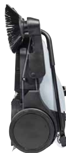
La trémie reste en place même lorsque la balayeuse est stockée en position verticale ou accrochée au mur