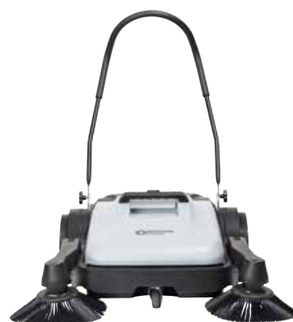
SW200 (1 brosse latérale) – et SW250 (2 brosses latérales) – couvrent des largeurs de nettoyage de 70 cm et 90 cm