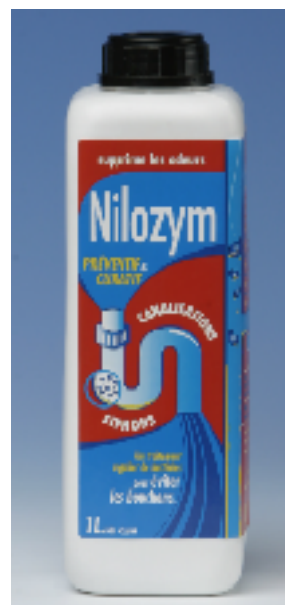
Code: LES 7500 & LES 7503