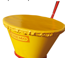
Bâche de couverture en option