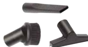
KIT ACCESSOIRES U2-U11-086